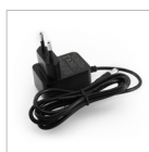
Alimentatore 5Vdc 2A

1x Alimentatore 5Vdc 2A - 5,5x2,1 Positivo centrale